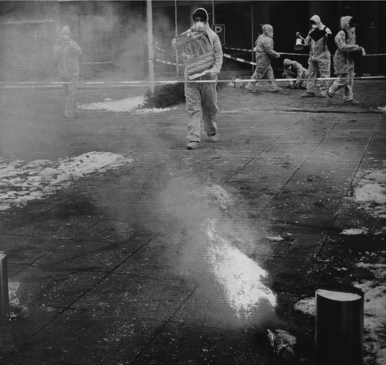
December 2010: 'ontsmettingsactie' bij het hoofdkantoor van bouwbedrijf BAM in Bunnik

ke actie. Direct, confronterend, maar wel geweldloos' en zegt zich verder niet bezig te houden met 'de actiemiddelen van afzonderlijke actiegroepen'.