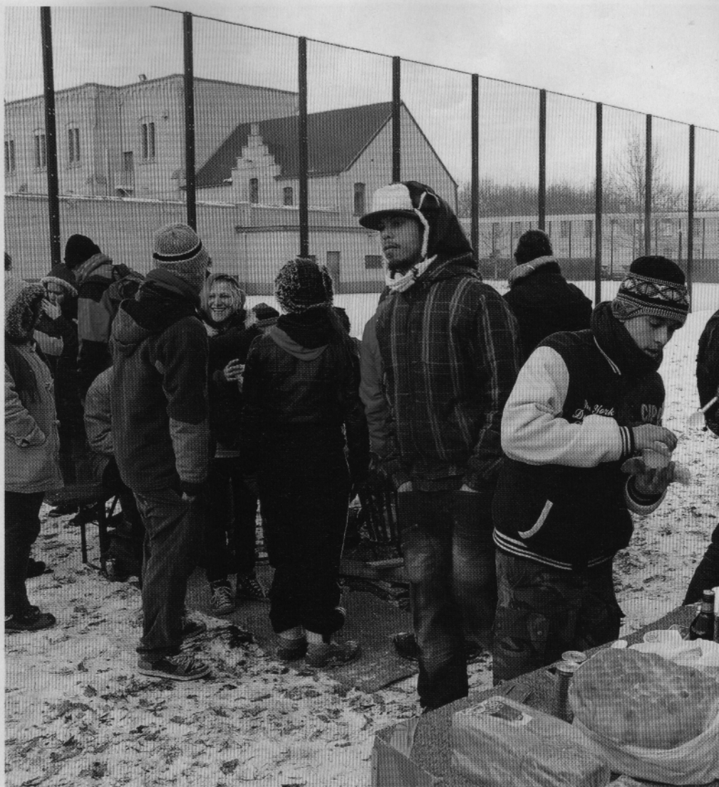
5 februari 2012: internationale protest bij detentiecentrum Merksplas in België

Maar als hij met een groep actievoerders bij een uitzendbureau voor de deur staat omdat zij bewakingspersoneel voor detentiecentra rekruteren, intimideert hij toch ook? 'Dat realiseer ik me best, maar ik mag mensen toch wel aanspreken op hun medeplichtigheid? Ik vertel waarom ik daar sta, en dat doe ik niet 's nachts maar op klaarlichte dag.' Toch snapt hij degenen die wel overgaan tot harde, ondergrondse acties ook. 'Ik begrijp de frustratie. Als je op Lampedusa bent geweest en de ellende in Calais hebt gezien, waar midden in de westerse beschaving honderden migranten in een tentenkamp zitten, moet je sterk zijn om reëel te blijven.'