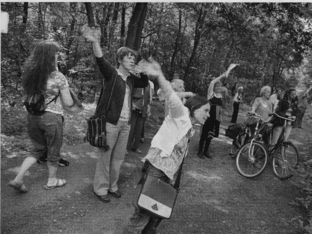
3 juli 2011: mensen zwaaien bij vreemdelingengevangenis Kamp Zeist naar gedetineerden