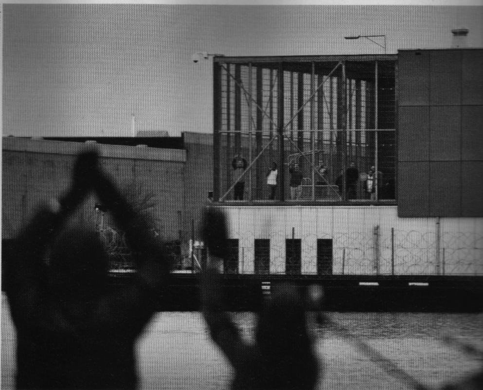
18 december 2011: actie bij de detentieboot in Zaandam

met terroristisch oogmerk, bleek uit de wetsartikelen die in de invezekeringstelling werden genoemd.