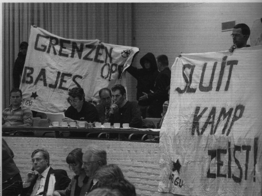
2008: protest van de Anarchistische Anti-deportatie Groep Utrecht in de raadszaal van Soest

'Janneke' ziet het vanaf een afstandje aan. Ze is in de loop der jaren bozer en bozer geworden, zegt ze. Een tijd lang ging ze als vrijwilliger op bezoek in de detentiecentra, maar ze is ermee gestopt. Emotioneel te belastend. Op sommige plekken zaten mensen rustig 23 uur in een cel. De bezoekgroepen hebben geheimhoudingsplicht, maar die misstanden moeten naar buiten, vindt ze. 'Het verhaal dat politieke en justitie vertellen is zó hypocriet.' En dan de politiek. 'Mensen mogen hier niet zomaar heenkomen, we moeten ze wel kunnen gebruiken. Man, we hebben ze al sinds Columbus